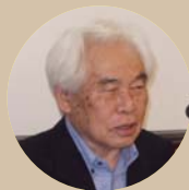
名誉学長 故・新藤兼人